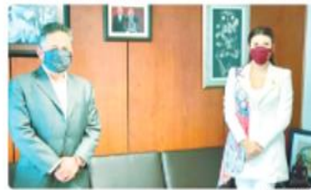
CIUDAD DE MÉXICO.- La alcaldesa Marina del Pilar Avila Omeda formalizó el trabajo de coordinación y colaboración, tras reunirse con el titular de la Unidad, Santiago Nieto Castillo.