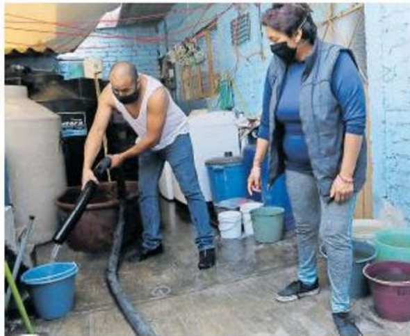
Algunos ciudadanos aseguran que no han tenido agua en más de tres días. CUARTO SOLERO

LA COMISIÓN Estatal de Servicios Públicos de Tijuana anunció este miércoles la suspensión del servicio de agua en más de 40 colonias