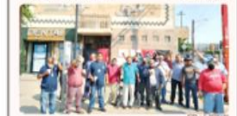
TIJUANA.- Trabajadores del Sindicato Liga de Choferes Roberto Lofraño Aguayo, apoyados por la Federación CFM, colocaron ayer las banderas rojinegras del estallamiento de huelga en las instalaciones de la empresa de transporte Azul y Blanco.