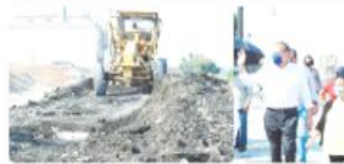
TIJUANA.- De forma simultánea se trabaja en la construcción de dos aulas y la pavimentación de 400 metros cuadrados de estacionamiento en la escuela primaria Félix Ortega Aguilar.